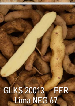
GLKS 20013 PER Lima NEG 67