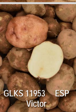
GLKS 11953 ESP Victor