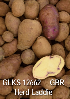
GLKS 12662 GBR Herd Laddie