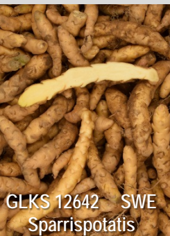
GLKS 12642 SWE Sparrispotatis