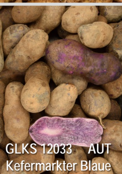
GLKS 12033 AUT Kefermarkter Blaue