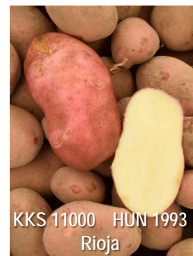
KKS 11000 HUN 1993 Rioja