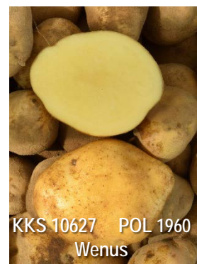
KKS 10627 POL 1960 Wenus