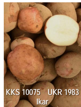
KKS 10075 UKR 1983 Ikar